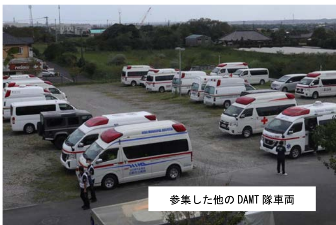
参集した他の DAMT 隊車両