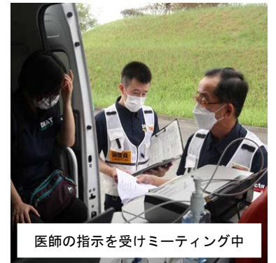
医師の指示を受けミーティング中