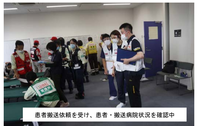
患者搬送依頼を受け、患者・搬送病院状況を確認中