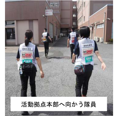
活動拠点本部へ向かう隊員